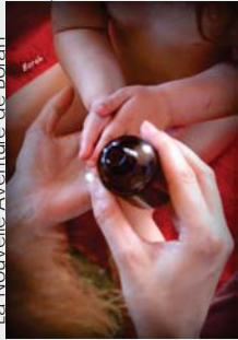
La Nouvelle Aventure de Borah

La semaine de la Petite Enfance et de la Parentalité s'est tenue du 20 au 25 avril, sur le thème des cinq sens.