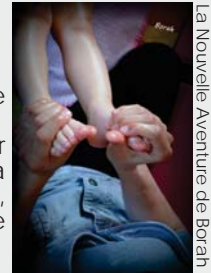
La Nouvelle Aventure de Borah

D'autres moments, davantage tournés vers la parentalité, ont eu lieu sur l'ensemble de la Haute Comté : cafés des parents, conférence/débat, soirées ciné/ débat, théâtre d'improvisation... Les parents ont pu échanger, et trouver quelques réponses à leurs questions, accompagnés de professionnels de la parentalité.